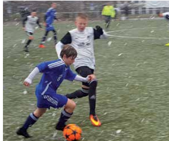
Tabelle U15 BOL