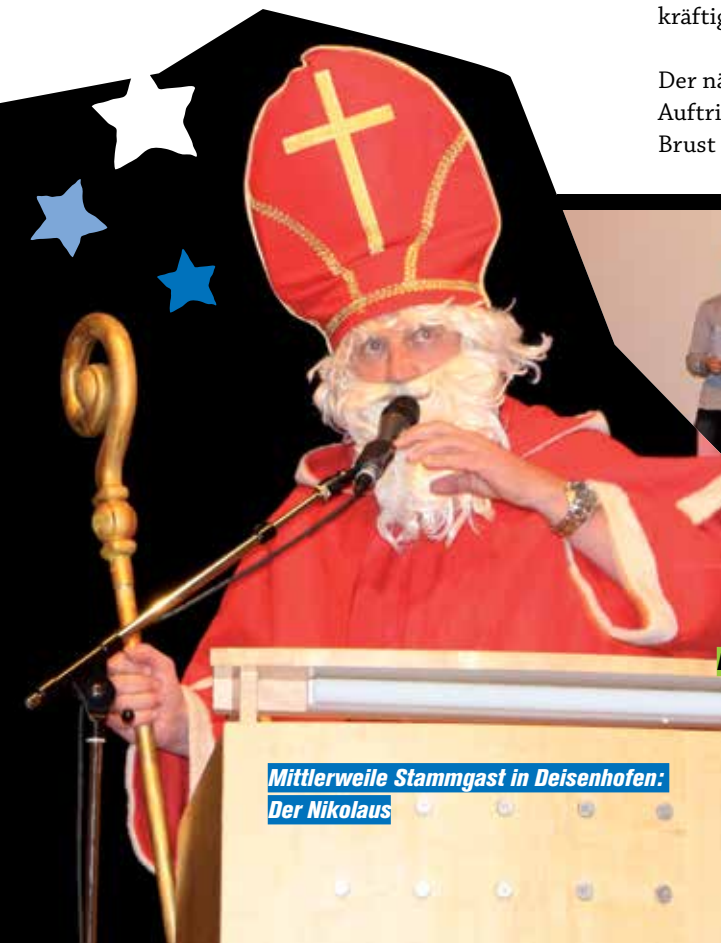
Mittlerweile Stammgast in Deisenhofen: Der Nikolaus

Der nächste Höhepunkt der Weihnachtsfeier war der Auftritt des Nikolaus, der sich jede Mannschaft zur Brust nahm, wie man es von einem angemessenen